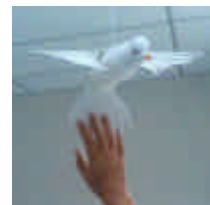
La mano creativa de Miriam