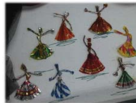
Bailaninas danzantes hechas con envoltorios de caramelos

VI Taller Oriental "Reutilización y reciclaje de las botellas de refresco (PET) como Ciencia y su Enseñanza en diversas comunidades del Edo. Sucre"