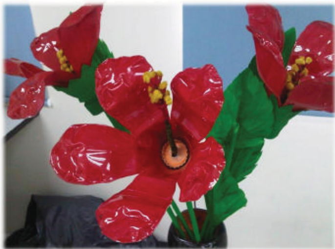
Cayenas hechas a partir de botellas de PET