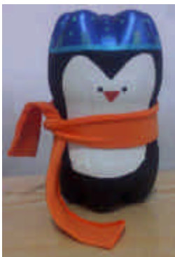
Pingüino de "Happy feet" elaborado por los estudiantes del Servicio comunitario de la UDO a partir de desechos de Botellas PET de refresco